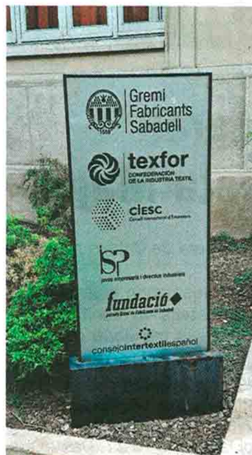
Seu de la Fundació

seua Fundació. A més, presideix la Fundació per l'ESDi (FUNDIT), que en el seu dia va impulsar la creació de l'Escola Superior de Disseny (ESDi), i el Barcelona Moda Centre (BMC), centre de negocis del sector de la moda ubicat a Sant Quirze del Vallès.